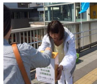
熊本・大分地震被災募金活動

また、市民が頼りにする防災拠点の重要性も、浮き彫りになりました。 今、建設中の新庁舎は、各部署との連携はもとより、市民が頼りとな る防災拠点となるように、私も市民の声を代弁、提言していき たいと思います。