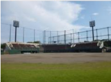
①第一カッター球場(秋津野球場)