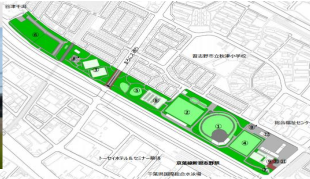
②第一カッターフィールド(秋津サッカー場)