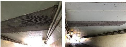
▲天井と壁の補強をしてもらいました。