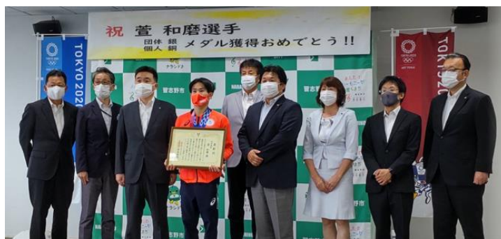
パリ2024 目指せ金メダル