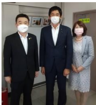
祝経済安全保障担当大臣 小林 鷹之 衆議院議員と