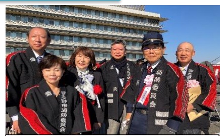
習志野市消防出初式

皆様からのご意見・ご要望は、FAX 047-452-0781 まで、お願い致します。