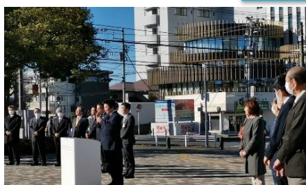
習志野市役所仕事始め式